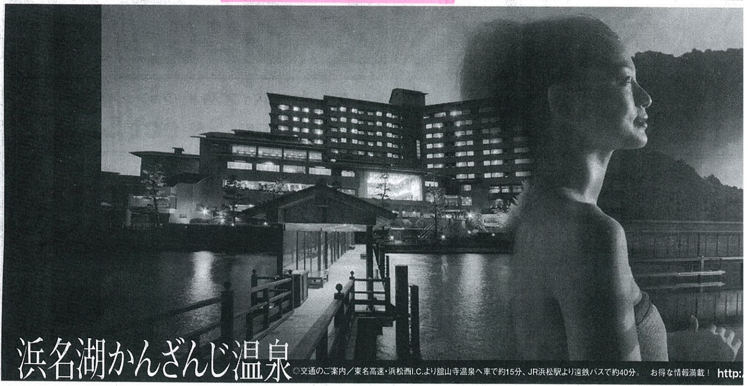
浜名湖かんざんじ温泉

交通のご案内 / 東名高速・浜松西I.C.より館山寺温泉へ車で約15分、JR浜松駅より遠鉄バスで約40分。お得な情報満載! http://